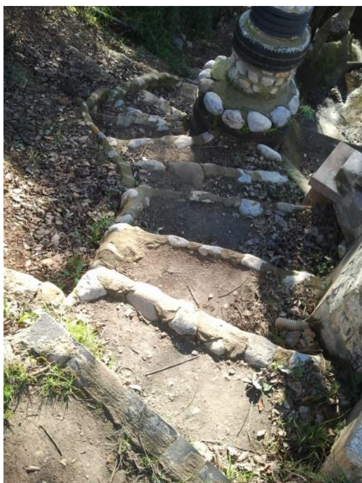
Escala Font Garrell