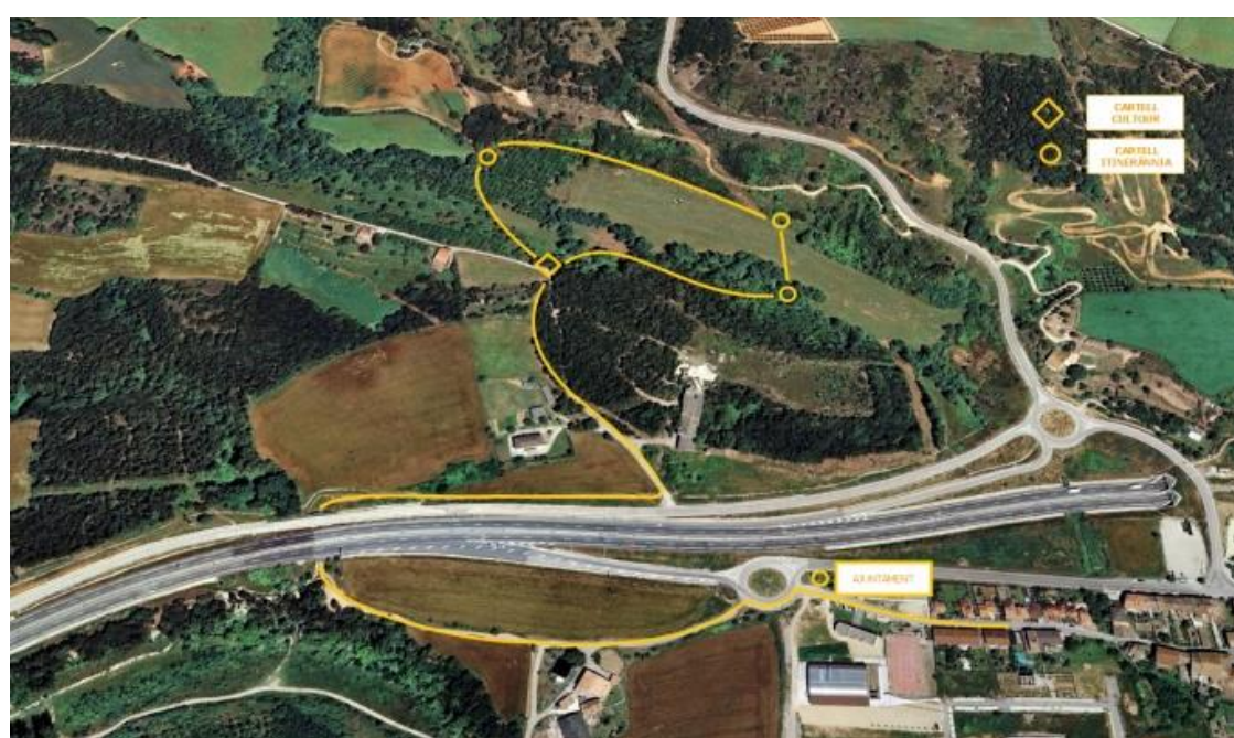
Itinerari a peu fins als prats de la Carlinada