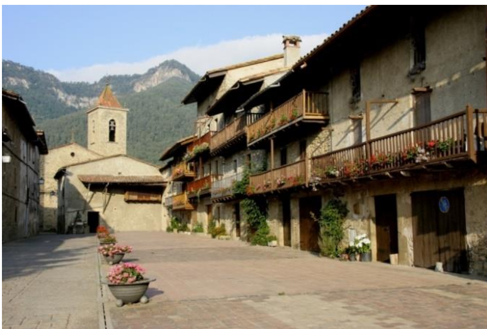
Hostalets d'en Bas